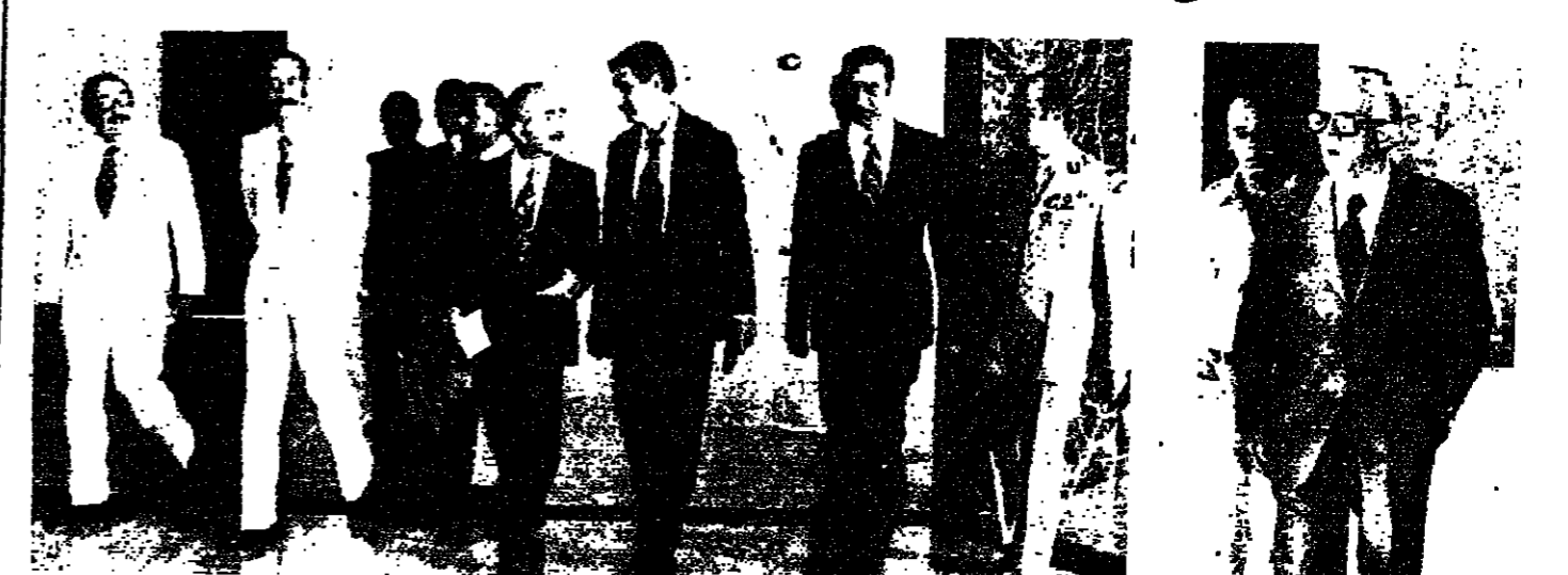
الرئيس كرامي والسيد كمال جنبلاط قبل اجتماع «هيئة الحوار الوطني» في القصر الجمهوري